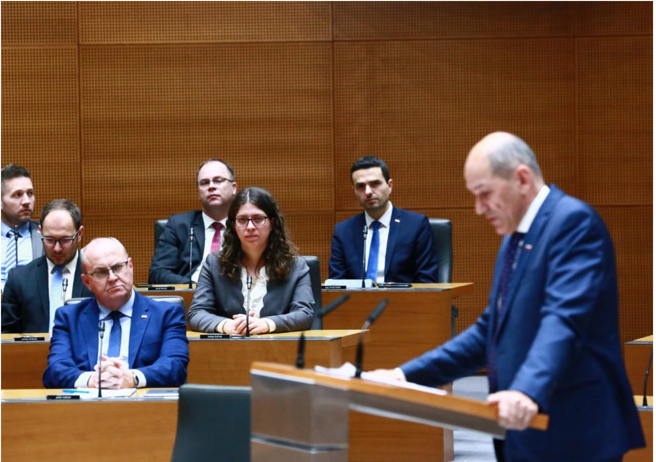
Janez Janša in poslanska skupina NSi

Ministri so bili izvoljeni z 52 glasovi poslancev koalicije, obeh manjšincev in SNS, proti jih je bilo 31 iz LMŠ, SD, Levice in SAB.