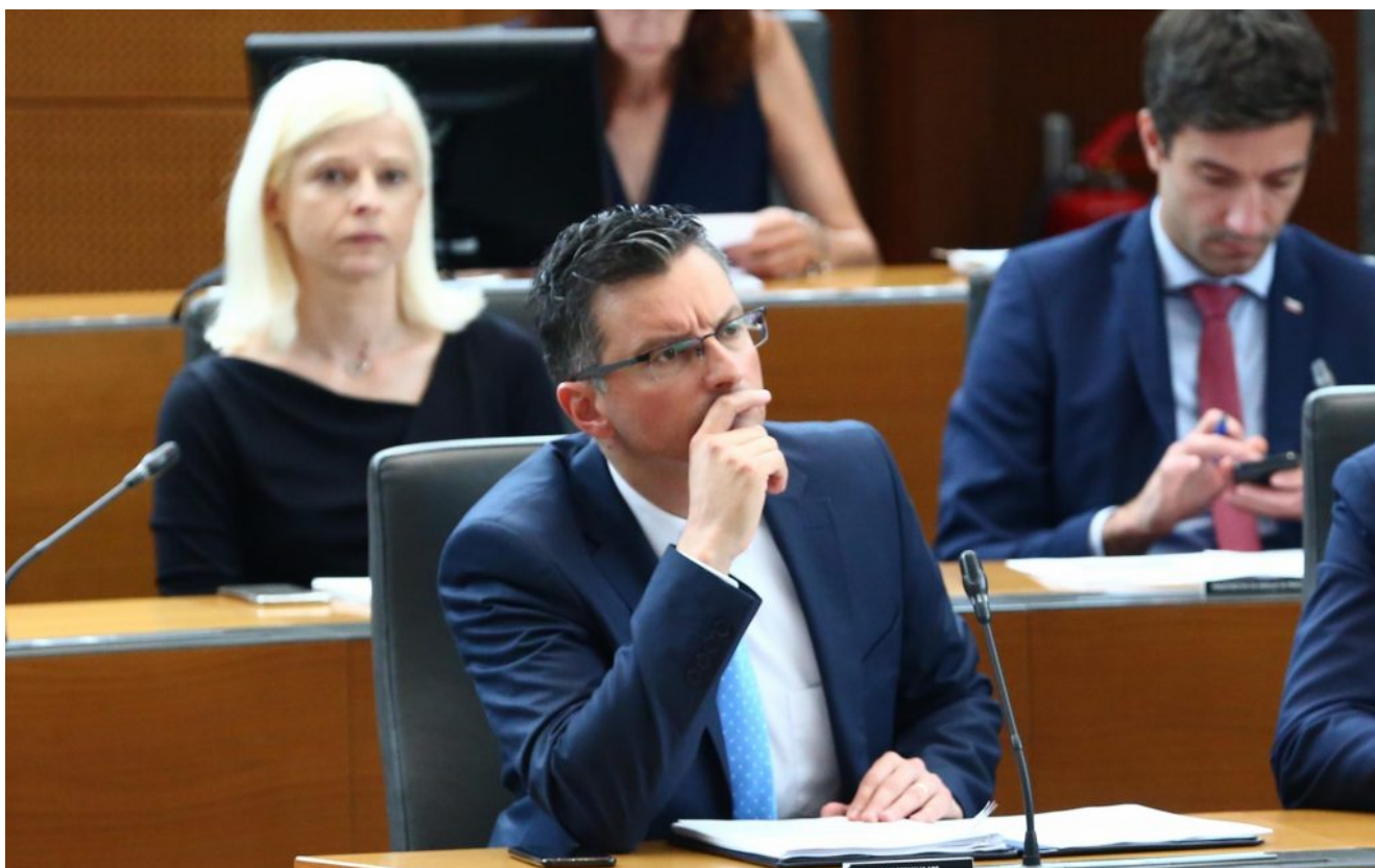
Premier Marjan Šarec, za njim Ksenija Klampfer