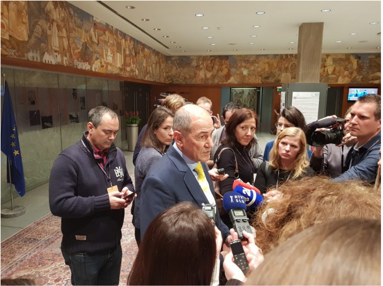
Janez Janša