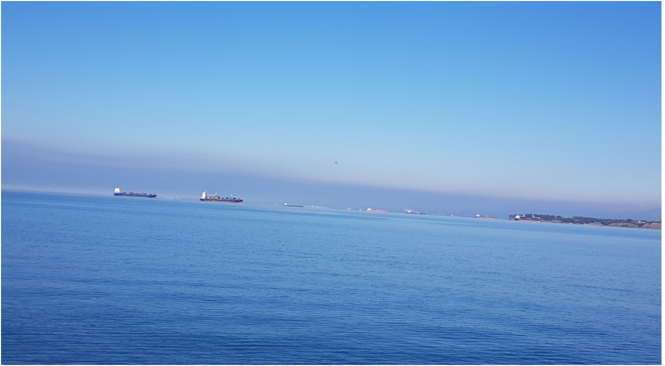
Čakajoče ladie pred Luko Koper