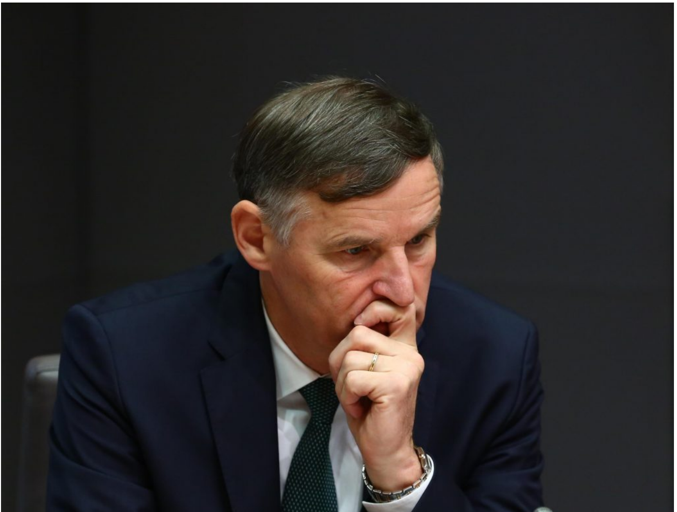
Finančni minister Andrej Bertonceelj

Umar je napoved rasti za prihodnje leto z jesensko napovedjo namreč znižaj iz 3,4 na 2,8 odstotka. Če se zaplete na mednarodnih trgih, pa lahko rast pade celo le na 1,7 odstotka, so v jesenski napovedi še opozorili iz Umarja . Na posnetku je finančni minsiter Andrej Bertonceelj, ki v času "debelih krav" poskuša varčevati: