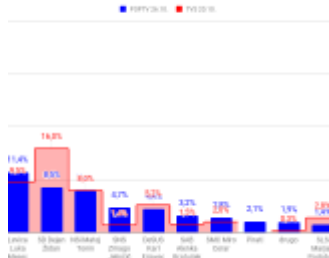
sed rezultati Mediane za POP in Ninamedie za T