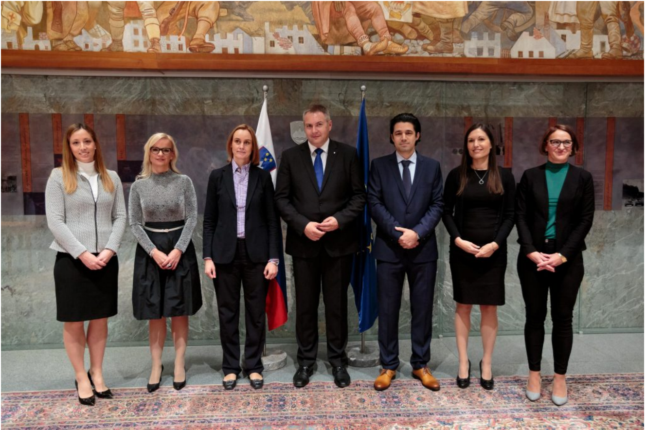
Prisega sodnika in petih sodnic

Z vidika enakosti spolov, kar oblast močno zagovarja pri zaposlovanjih sicer, je to dober rezultat v primerjavi s prejšnjo sejo. Prejšnji mesec so poslanci izvolili pet novih sodnic in niti enega samega sodnika.