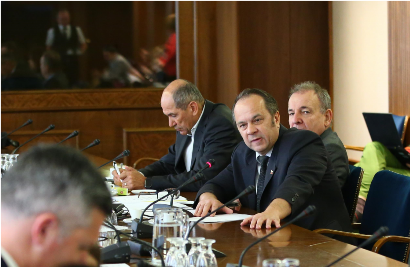
Janez Janša in Branko Grims, v ozadju Andrej Šircelj

Konec meseca bo ustavna komisija prvič razpravljala še o vladnem predlogu, ki ga je že na začetku mandata podprl predsednik državnega zbora Dejan Židan (SD), da bi v ustavo dodali člen, ki bi dodatno zavaroval pravice gluhih in slepih z določbo: