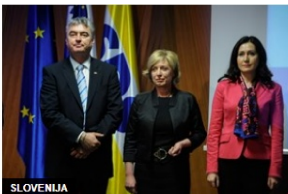
Zmaga liste SDS in SLS, preferenčni glas napoveduje možnost presenečenja

Zadnje raziskave, iz katerih sem črpal podatke za prikaze, so dostopne na povezavah (pri Dnevniku le za tiste, ki plačajo dostop):