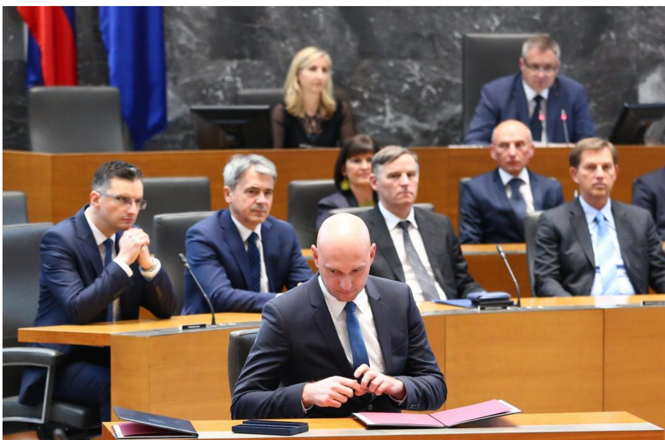
Minister za okolje Simon Zajc

“Rad bi rekel hvala vsem, ki ste glasovali za. Kot minister se bom trudil vsak dan, da bom to vaše zaupanje opravičil, želim si pa, da bi z vsemi vami dobro sodelovali, ker verjamem, da bomo na ta način za okolje naredil še več.”