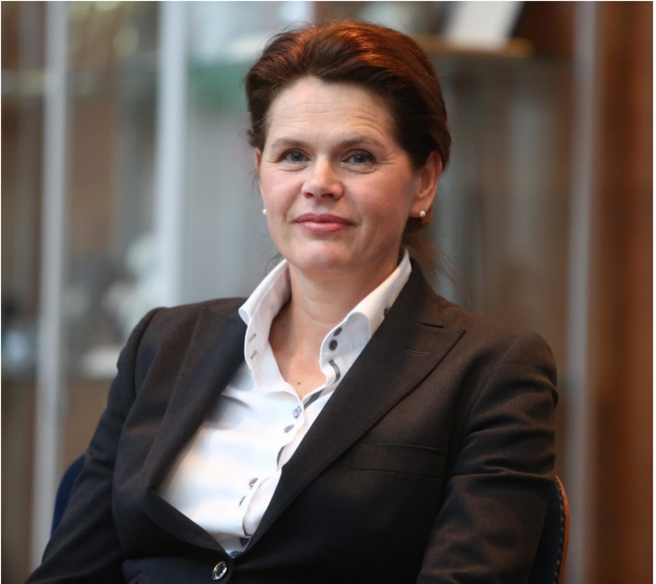
Alenka Bratušek