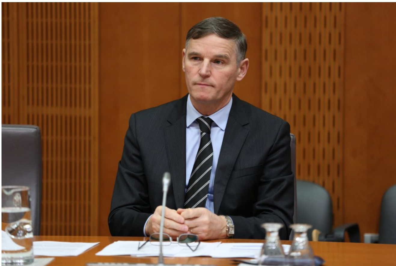
Finančni minister Andrej Bertoncelj

Prva stvar, za katero je letos zmanjkalo denarja in jo je vlada plačala iz omenjenih rezervacij, je bila povprečnina občinam. Občine imamo že desetletja in ni težko načrtovati izdatkov zanje. Tri milijone evrov je vlada januarja na predlog finančnega ministra Andreja Bertonclja iz rezervacij prerazporedila občinam, ker je kljub temu, da ni težko načrtovati, že januarja zmanjkalo denarja zanje. Čez celo leto bi zmanjkalo kar 18.370.510 evrov, ker so vladajoči konec leta občinam dodelili krepko več denarja, niso pa popravili proračunskih načrtov. Zdaj bi takšna plačila, ko napak načrtujejo ali porabijo krepko več kot so si sami v parlamentu dovolili, spremenili kar v pravilo in zakon. Kot razlog so zapisali nepredvidljive stroške v povezavi z vodenjem EU. Zakonodajno pravna služba pa opozarja, da je to precej slab