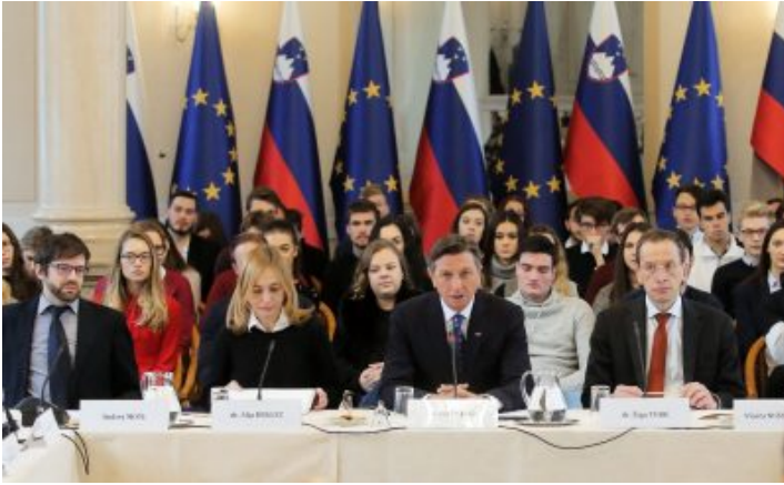
Posvet o svobodi govora in sovražnem govoru

Čeferin je o uredniku skrajnega antijudovskega propagandnega glasila