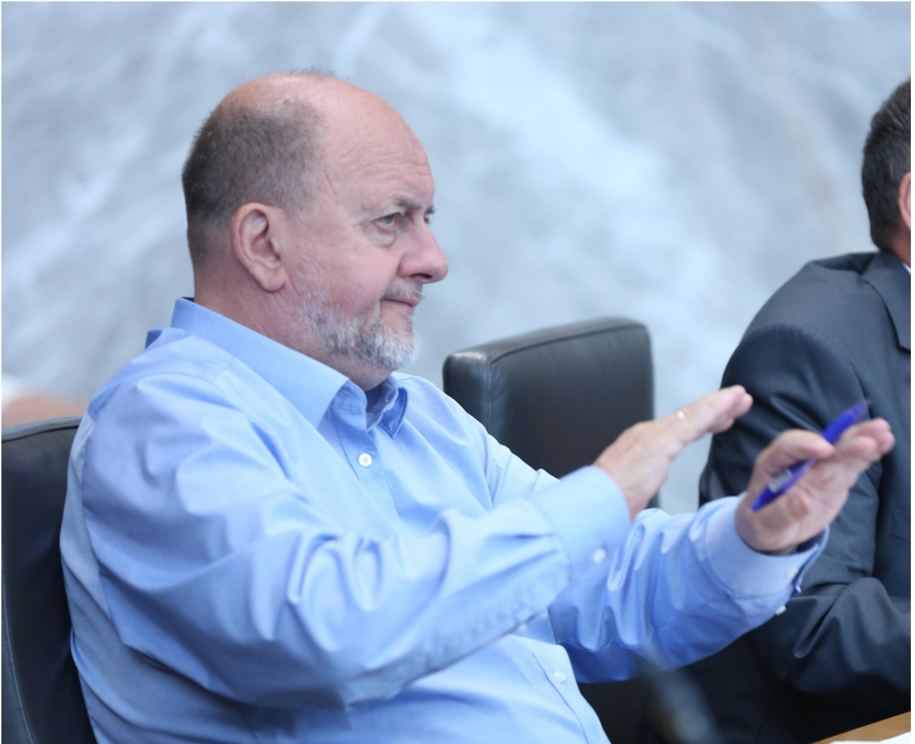
Predsednik SNS Zmago Jelinčič

O dilemah dogajanja lahko svoje mnenje predstavite v anketi: