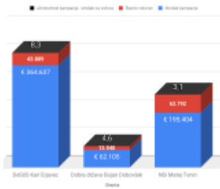
anija DeSUS za DZ: Kurjenje denarja v prazno