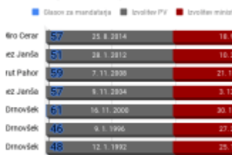
so nastajale vlade po letu 1992