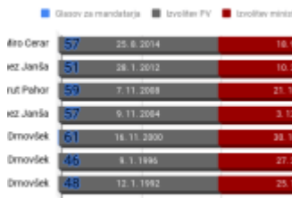
so nastajale vlade po letu 1992