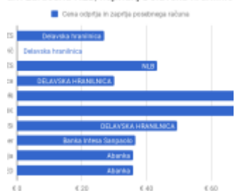
am zaračuna NLB, najmanj Delavska hranilnica