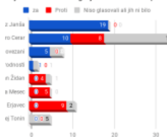
anije zaradi katerega je iz SMC izstopil Z