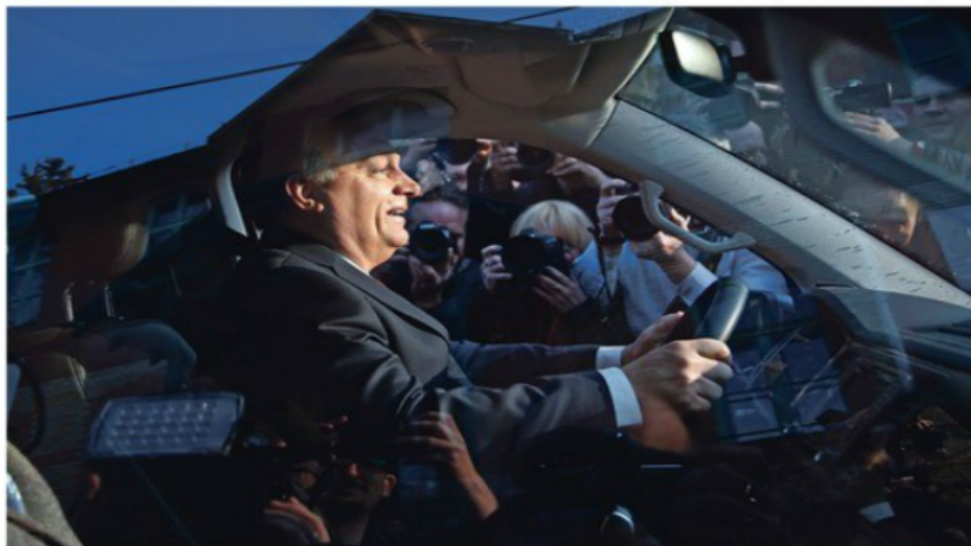
Viktor Orbán je zmagovalec madžarskih parlamentarnih volitev, že tretjič zapored, vendar je njegova stranka Fidesz dobila manj, kot je pričakovala.

Madžarske volitve Po neuradnih rezultatih bo imela nova vlada Viktorja Orbána v parlamentu 116 poslancev