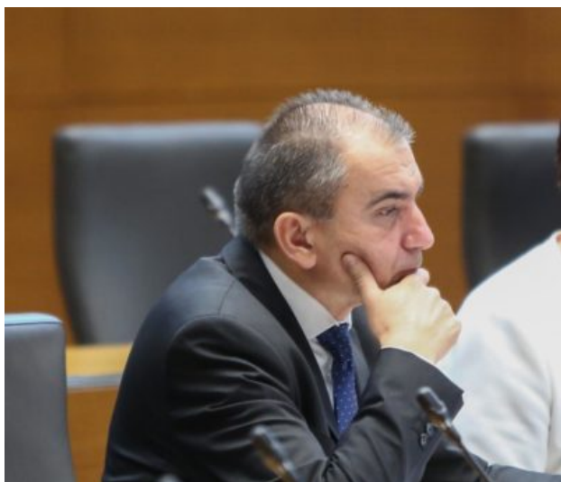
Janko Veber

S seznanitvijo s Pahorjevim sporočilom, da ne bo iskal naslednika Mira Cerarja, bo državni zbor korak bližje razpustitvi. Začel bo teči dvotedenski rok, v katerem lahko novega šefa vlade predlagajo poslanske skupine ali najmanj deset poslancev. Da je pripravljen kandidirati, je takoj po