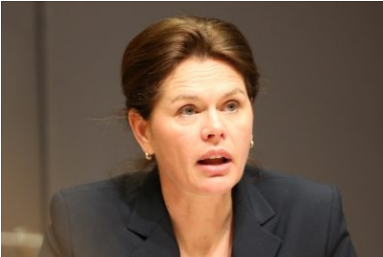
Nekdanja premierka Alenka Bratušek.

Zaradi ostrih omejitev, kako je dovoljeno zbirati denar (prepoved darovanj za pravne osebe, ostre omejitve in nadzor pri fizičnih osebah in posojilih), ki jih je leta 2013 uzakonila koalicija, ki je postavila vlado Bratuškove (PS, SD, DL, Desus) se je zdelo, da bo nova stranka Zavezništvo Alenke Bratušek težko zbrala denar za kampanjo. A šefici vlade Alenki Bratušek, ki jo je nasledil Miro Cerar , so v manjšem delu pristaši, predvsem pa Abanka posodili dovolj denarja, da je poravnala stroške kampanje, pa čeprav na pogon samih pufov. Pomembno vlogo Abanke sem opazil na nenavaden način: Zaab pozneje, že po volitvah, na svoj račun ni dobivala državnih dotacij, ki jim pripadajo po zakonu. Po dotaciji 29.8.2014 v višini 11.910 evrov takoj po volitvah dolgo niso dobili niti centa dotacij. Iz državnega zbora, od koder sem dobival podatke o nakazilih državnih dotacij strankam, so mi nekoliko skrili, da dotacij ne pošiljajo več Zaabu. Posojila so iz stranke sicer razkrili v letnem poročilu stranke, ki so ga oddali v začetku leta 2015, a tam na nekoliko nejasen način. V letnem poročilu za leto 2014 tako: