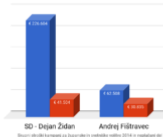
Sani računi za županske in svetniške kampanje 2014

Smo pred dvojnimi volitvami. Kampanje političnih strank, ki neuradno že potekajo, bodo opustošile proračune strank in vsaj del strank se bo močno zadolžil in tudi goljufal. Med strankami že pred volitvami izstopa SD Dejana Židana , ki z minusom že prihaja proti volilnemu letu. Ne ravno prvič. Področje financiranja strank in kampanj ureja pred štirimi leti v času vlade Alenke Bratušek ostro reformirana zakonodaja, ki je precej nenavadna in ima velike luknje. Po zakonu lahko kandidata ali stranko drago stane majhen prispevek ali posojilo, če ga dobi od društva ali podjetja. Visoke globe doletijo tudi darovalce. Ni pa kazni, če stranka za kampanjo sploh ne plača stokrat več računov. To stranke počnejo. Denimo omenjena SD. Ureditev je na videz tudi nekoliko koruptivna. Dovolila je posojila politikom iz bank, ki so jih ti z državnim denarjem sanirali. Ena saniranih je bila A-banka, ki je praktično v celoti plačala kampanjo nove stranke takratne premierke Alenke Bratušek pred štirimi leti. Posojilo je bilo vrnjeno iz državnih dotacij tej stranki v prihodnjih letih.