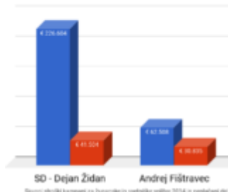
Sani računi za županske in svetniške kampanje 2014

Smo pred dvojnimi volitvami. Kampanje političnih strank, ki neuradno že potekajo, bodo opustošile proračune strank in vsaj del strank se bo močno zadolžil in tudi goljufal. Med strankami že pred volitvami izstopa SD Dejana Židana , ki z minusom že prihaja proti volilnemu letu. Ne ravno prvič. Področje financiranja strank in kampanj ureja pred štirimi leti v času vlade Alenke Bratušek ostro reformirana zakonodaja, ki je precej nenavadna in ima velike luknje. Po zakonu lahko kandidata ali stranko drago stane majhen prispevek ali posojilo, če ga dobi od društva ali podjetja. Visoke globe doletijo tudi darovalce. Ni pa kazni, če stranka za kampanjo sploh ne plača stokrat več računov. To stranke počnejo. Denimo omenjena SD. Ureditev je na videz tudi nekoliko koruptivna. Dovolila je posojila politikom iz bank, ki so jih ti z državnim denarjem sanirali. Ena saniranih je bila A-banka, ki je praktično v celoti plačala kampanjo nove stranke takratne premierke Alenke Bratušek pred štirimi leti. Posojilo je bilo vrnjeno iz državnih dotacij tej stranki v prihodnjih letih.