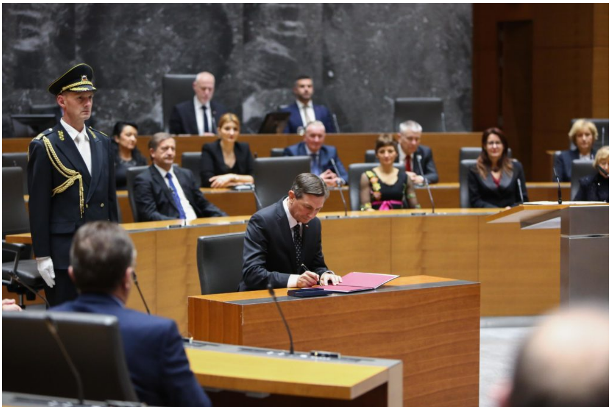
Podpis prisege predsednika Boruta Pahorja

“Končujem z ugotovitvijo, ki mi ne da miru odkar sem jo prvič slišal. Neka znana romantična drama se začne z ugotovitvijo, da ljudje tik pred smrtjo, naj bo naravne ali nasilne narave, mislimo na sporočila ljubezni, nikoli in nikakor na sporočila sovraštva. Povedano drugače, v stiski s časom pred nečim hudim, pred nečim dokončnim, morda pred zadnjim slovesom, ne