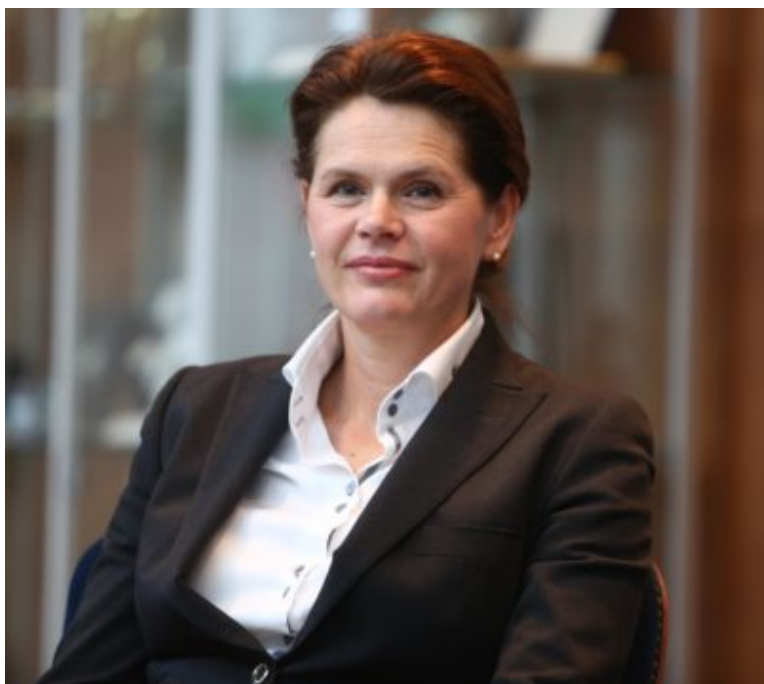
Nekdanja premierka Alenka Bratušek

Županska funkcija je Jankoviču po izvolitvi za poslanca celo avtomatično ugasnila, zaradi česar so v Ljubljani morali razpisati nadomestne volitve. Dodatno se je zapletlo, ko Jankovič pozneje ni bil izvoljen za šefa vlade, zaradi česar je izgubil ves interes za poslansko delo in je šel na nadomestne županske volitve, ki jih je sam povzročil, na njih pa je bil ponovno izvoljen za župana, zaradi česar mu je ugasnila poslanska funkcija.