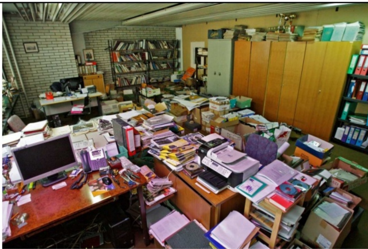
Slika 2: Prostor muzeja

Kako ustrezno je oblast rešila prostore muzeja, kaže ta posnetek: